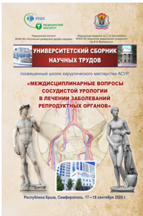
Университетский сборник научных трудов

В рамках проведения Школы с хирургическим мастер-классом в Республиканской клинической больницы им. Н.А. Семашко города Симферополя «Междисциплинарные вопросы сосудистой урологии в лечении заболеваний репродуктивных органов» в сентябре 2020 года межвузовский коллектив спикеров конференции МИ ФНМО Российского университета дружбы народов и Медицинской академии имени С. И. Георгиевского ФГАОУ ВО «Крымский федеральный университет имени В.И. Вернадского» анонсировал выход совместного Университетского сборника научных трудов