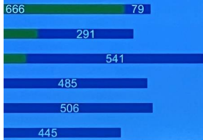
Динамика по фазам